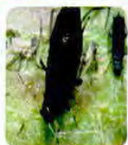
Piolho negro ( Aphis arbuti )