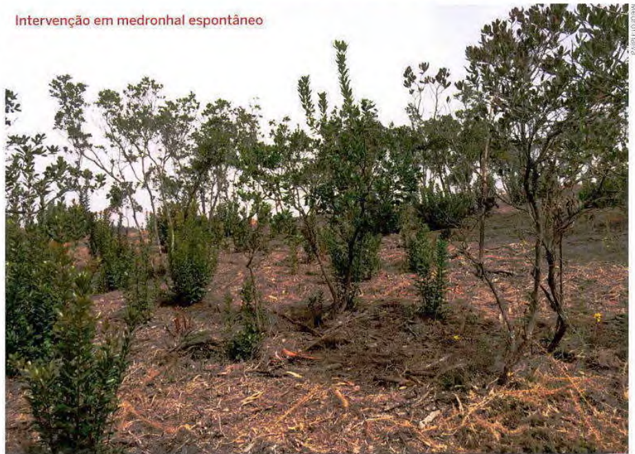
Intervenção em medronhal espontâneo

conhecimento e a divulgação da cultura do medronheiro e do medronho, e prepararem a fase de comercialização, uma vez que a maioria dos 40 associados só deverá ter produção dentro de três/quatro anos.