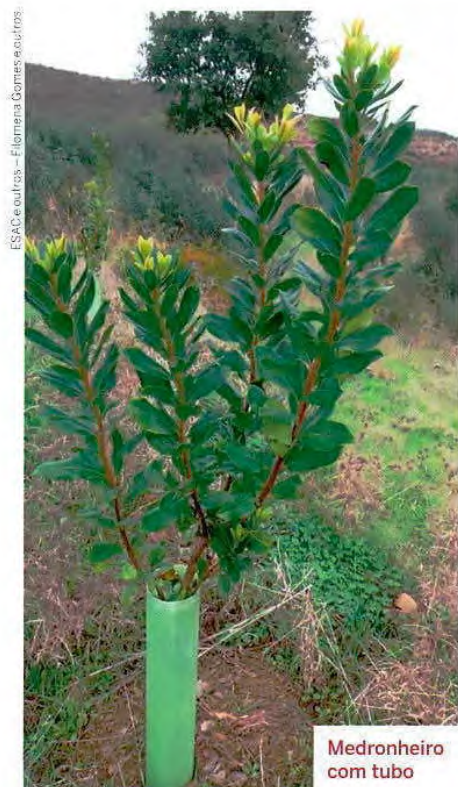
Medronheiro com tubo

estes, e outros, para perceber o potencial da cultura do medronho nesta altura.