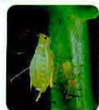
Piolho verde ( Aphis Waegreniella nervata )