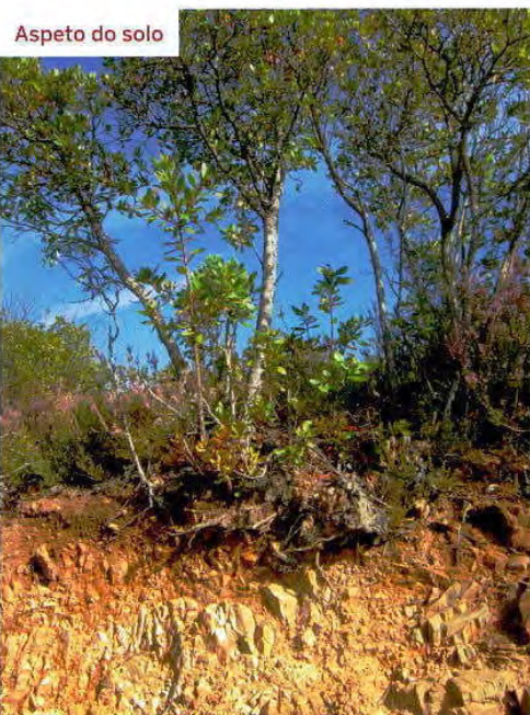
Aspetto do solo