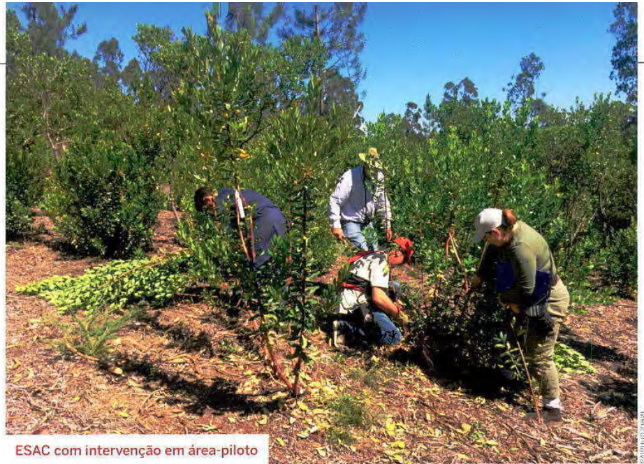
ESAC com intervenção em área-piloto

A Cooperativa Portuguesa de Medronho (CPM) é uma instituição recente, com cerca de dois anos e meio, e surgiu quando vários jovens se interessaram pela cultura do medronho e decidiram associar-se para terem maior representatividade, estimularem o