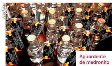
Aguardente de medronho