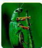
Gorgulho ( Gorgulho phyllobius sp )

Os resultados do estudo desenvolvido mostram ainda que os medronhos da Serra da Beira, que os investigadores têm usado no trabalho, “apresentam uma atividade antioxidante superior à de frutos de outras proveniências, tanto de Portugal como de outros países europeus”.