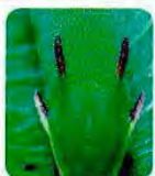
Borboleta / Lagarta do Medronheiro ( Charaxes jasius )