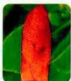
Traça do Medronheiro ( Cacoecia orphana pronubana )